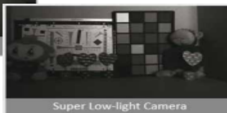
Super Low-light Camera