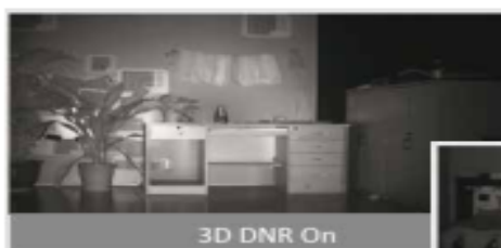
3D DNR On