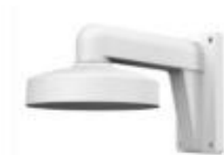
Indoor/outdoor wall mount DS-1272ZJ-110-TRS