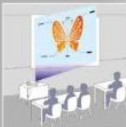
Sin corrección trapezoidal horizontal