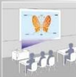
Con corrección trapezoidal horizontal