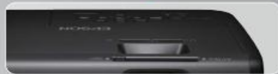
Obturador de lente

El obturador de lente deslizable para silenciar el sonido y apagar la imagen es una característica única de Epson. Al cerrar el "obturador de lente," se atrae la atención de la audiencia hacia el usuario y se reduce un 20% el consumo de energía.