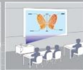
Con corrección trapezoidal horizontal