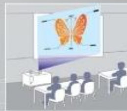
Sin corrección trapezoidal horizontal