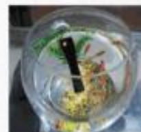
Aprueba de agua