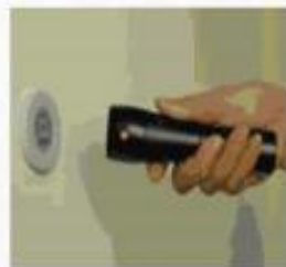
Al acercarlo al punto RFID captura la hora, cada punto maneja una identificación.