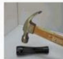
Resistente al golpe

Garantice la labor de vigilancia en su empresa