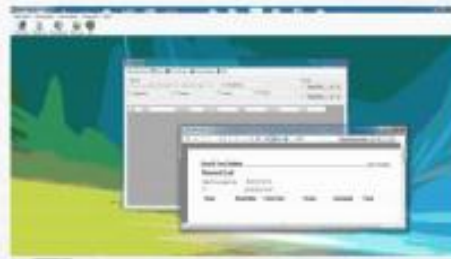
De este modo en el reporte se puede observar la hora en que estuvo en ese punto.